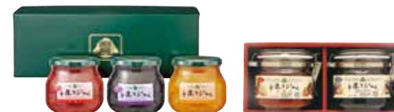
▲自社製手造りジャムセット(100株以上)

9月末日(決算期末)現在の株主名簿に記載された1単元(100株)以上保有される株主さま1名につき、当社オリジナル商品「GREEN WOOD手造りジャム」1セットを贈呈しています。家庭で作るように、果実と糖と果汁のみで煮詰めました。果肉たっぷり、当社が自信を持ってお勧めする商品です。